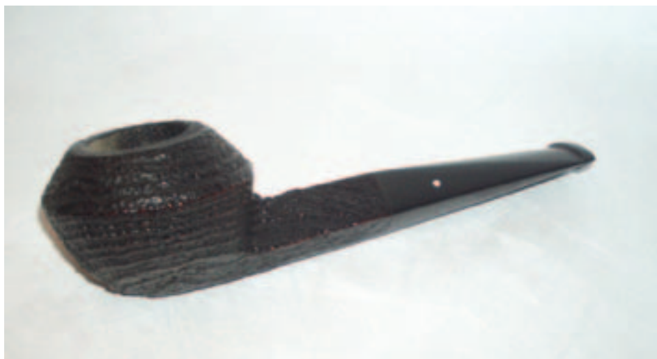
Denne Dunhill model 3117, var i år 2000, den første, eneste og sidste af sin slags i Danmark. Eller hvad?