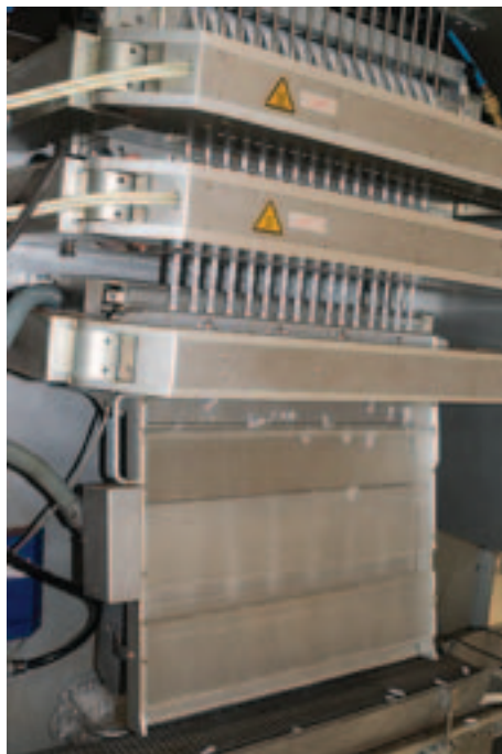
Denne sindrige maskine pakker snusen i de små portionsposer.

melige ingredienser som de har udviklet i deres eget laboratorium. De smagsstoffer, der bruges i snus er ikke de samme som anvendes i produktionen af pipetobak, da aromaerne opfører sig markant anderledes, når de kommer direkte i munden end når de først forbrændes i en pipe.