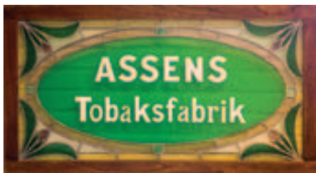
Flere ting er bevaret fra tiden i Østergade. Bl.a. dette flotte blyindfattede glasskilt.

af de uønskede stoffer. PPM står for Parts Per Million, hvilket groft forklaret vil sige, at hver gang man har en million partikler i en given mængde tobak, så er kun to af dem TSNAs. Tobakkerne kommer fra USA, Guatemala, Brasilien, Argentina, Filippinerne, Indien og udvalgte EU-lande. På grund af de store krav, der stilles til tobakken, skal den bestilles hos producenterne et år i forvejen og hos AG Snus har man konstant tobak på lager til to års produktion, så man er garanteret mod år med fejlsagen høst og andre uforudsete hændelser.