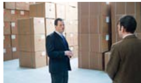
Der er råtabak fra gulv til loft på lageret - nok til to års produktion.

ikke længere. Jeg forventer dog, at de amerikanske forskningsresultater på sigt vil påvirke holdningen i EU. FDA (Food and Drug Administration. Det amerikanske svar på den danske Sundhedsstyrelse. –red.) foretager nogle meget grundige undersøgelser på området baseret på videnskabelige facts. Indtil videre er det påvist, at det er 90-98% mindre skadeligt at bruge snus end det er at ryge cigaretter, og det kan man ikke blive ved med at ignorere. Så jeg forventer en oplblødning på området og et langt større marked på sigt.”