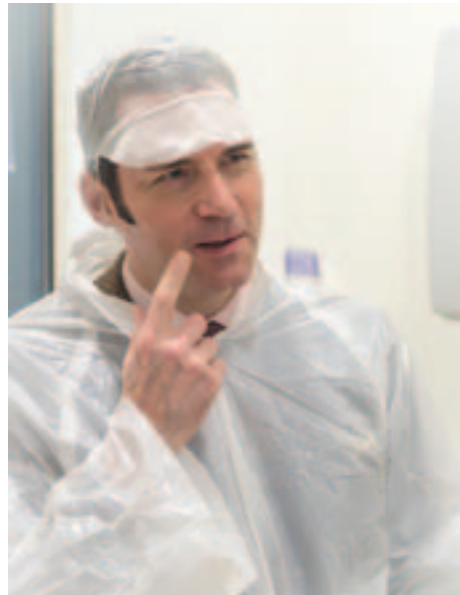
Deres udsendte - behørigt påklædt til besøg i produktionsområdet, prøver en portionssnus under overlæben.