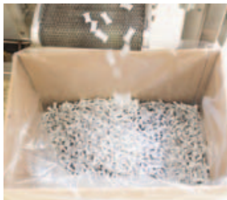
Portionsnus i kassevis, men ikke til det danske marked.

I en verden hvor det bliver mere og mere problematisk at ryge sin tobak, har AG Snus sat sig det mål, at producere røgfri tobak af højeste kvalitet. Mange bruger snus som et supplement til røgtobak, men i fx Sverige, som er AG Snus' største marked, er der mange som kun bruger snus og aldrig har røget, og ikke nok med det, de omfatter snusen med samme passion som vi