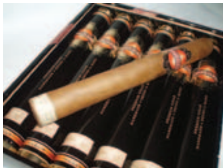
Candlelight Churchill Tubos måler 18 x 165 mm og koster 35,- kr. stykket. En god cigar i festlig indpakning.

Candlelight er nok bedst kendt herhjemme for deres maskinrullede serie, hvor man får rigtig meget cigar for pengene. Nu er der også en Churchill tubos på markedet, som håndruller på von Eickens egen fabrik i Santiago de los Caballeros i Den Dominikanske Republik. Den er også ganske billig og så er røret, som cigaren leveres i, tilmed lidt af et udstyrstykke. Så hø-