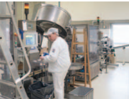
Hele produktionsområdet bærer tydeligt præg af de høje krav til hygiejne.

riet. Dels for at sikre, at kvalitet og smag er som den skal være, dels for at kontrollere, at de strenge krav, der er foreskrevet i lovgivningen til stadighed overholdes.