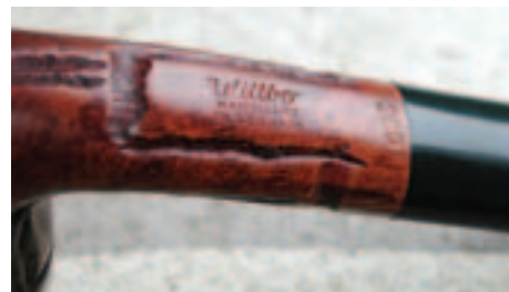
Nærbillede af stemplerne på en Willbo-pibe.