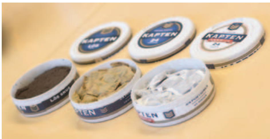
Nogle af snusprodukterne fra AG SNUS.

1864 Original har også lidt lakrids samt lidt sødme, som jeg fornemmer lidt som althea bolsjer. En meget distinkt smag, som jeg foretrækker til om formiddagen. 1864 skrå ligger i en rund lommevenlig dåse i plasticmateriale.