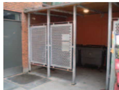
En moderne Smoking Lounge på en ambitiøs virksomhed i dagens Danmark.

den tid, hvor man om morgenen kunne pakke en fire-fem piber og tre slags tobak i sikker forvisning om, at man nok skulle få brug for det hele i løbet af dagen. Nu kan jeg nyde en pipe om morgenen og så gå i gang med at ryge igen, når jeg er kommet hjem. Begreber som en god formiddags- eller eftermiddagstobak har mistet deres betydning uden for weekender og ferier. Jeg kan selvfølgelig godt ryge på mit arbejde i selskab med de andre forviste nede i skuret i gården sammen med alle affaldscontainerne. Det gør jeg også gerne, men mest fordi det er der alle de vigtigste informationer lækkes først og fordi der i skuret er en god og munter tone. Der er ikke meget afslapning og æstetik over det til trods for, at det ikke kan nægtes, at det har sin egen besynderlige charme. Og hvad gør