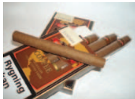
En fiks lille cigar til en hurtig pause. Handelsgold Coffee – Kaffe- og rygepause i ét!

Så er der kommet endnu en variant af de små flavouriserede cigarer fra Handelsgold. Denne gang med kaffesmag. Nu er jeg mest til den rene vare, men man skal jo ikke være bange for at prøve noget nyt. Når cigaren antændes har den en meget voldsom smag af kaffe med fløde og sukker. Denne smag dæmper sig dog ret hurtigt efter et par sug, og flavouren aftager i takt med at smagen fra tobakken bliver mere fremtrædende. Den har en mængde gode noter og er faktisk ganske behagelig at ryge. Styrken er mild. Pris for æske med 5 stk. Kr. 12,-. Fra C.B. Møller og Co A/S, tel: 35 26 65 44.