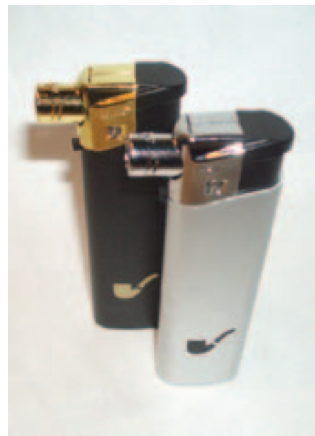
Atomic, genopfyldelig pibelighter til 12 Kr. Så ingen grund til tårer, hvis den bliver snuppet i lufthavnen.

Hører du til dem, der ustandseligt smider din lighter væk, eller skal du bare have en liggende i bilen, kolonihaven eller garagen, så er Atomic den helt rigtige lighter. Den er så billig at den