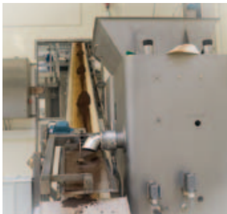
Her er råtabakkerne blevet til pulver i forskellige kornstørrelser, blandet til den type snus som produceres lige nu og køres videre til varmebehandling.

Fordi snustobakken konsumeres direkte i munden, og ikke først brændes af og kommer ind i munden i form af røg, så er snusproduktion underlagt de samme strenge love, regler og forordninger som fødevarerindustrien. Det er således kun i de indledende faser af produktionen, hvor råtabakken vælges på lageret og efterfølgende kommer i den store kværn, der maler tobakken til pulver, at den er i kontakt med menneskehænder. Herefter foregår alt i lukkede og automatiserede systemer. Snusen males i tre kornstørrelser, fin, mellem og grov. Grunden til dette er, at man ved at blande de tre malingsgrader korrekt sikrer, at snusen afgiver nikotin og aroma på den rigtige måde. Den fintmalede tobak gør, at snusen begynder at virke så snart den kommer i kontakt med mundens spyt og de grovere korn gør, at det hele ikke afgives med det samme, men at snusen kan nydes over længere tid. Blandingsforholdet er individuelt alt efter hvilken type snus der er tale om. Når snusen er malet, føres den via et sindrigt rørsystem gennem væggen til det tilstødende lokale, hvor snusen varmebehandles for at gøre det af med bakterier, svampesporer og lignende. Når snusen er kølet af tilsættes der forskellige former for smag. Den mest anvendte er lakrids, men AG Snus har naturligvis også en mængde hem-